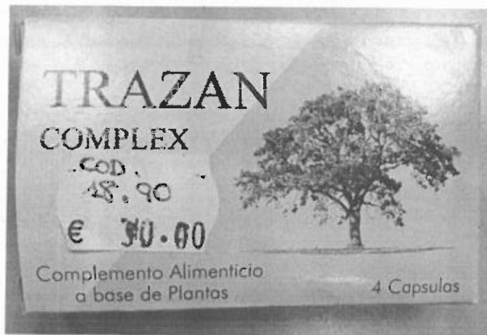
Fig.1: Imagen del producto TRAZAN COMPLEX CÁPSULAS.

La prohibición de la comercialización y la retirada del mercado de todos los ejemplares del citado producto.